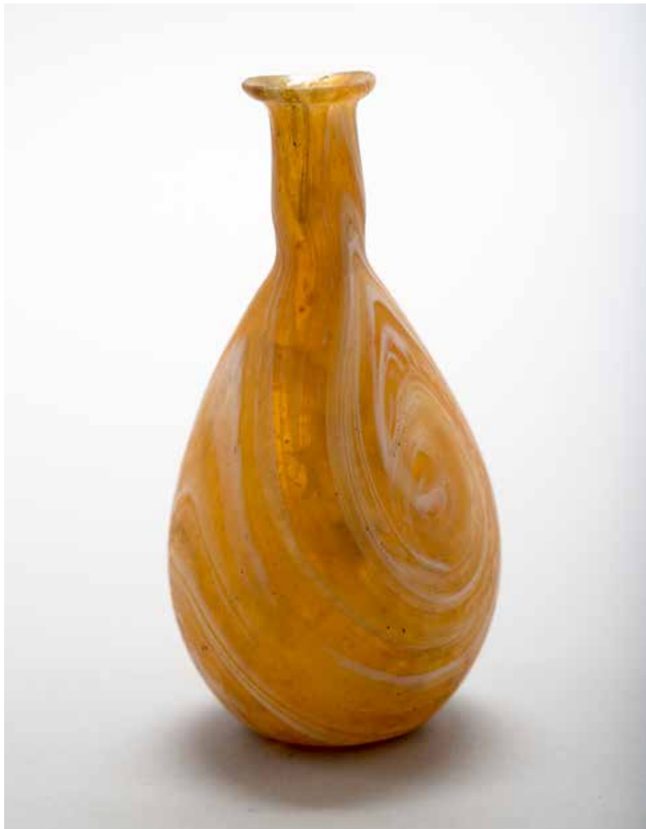
Balsamaire en verre coloré, I er – III e siècle ap. J.-C., aire funéraire d'I Ponti, Mariana.