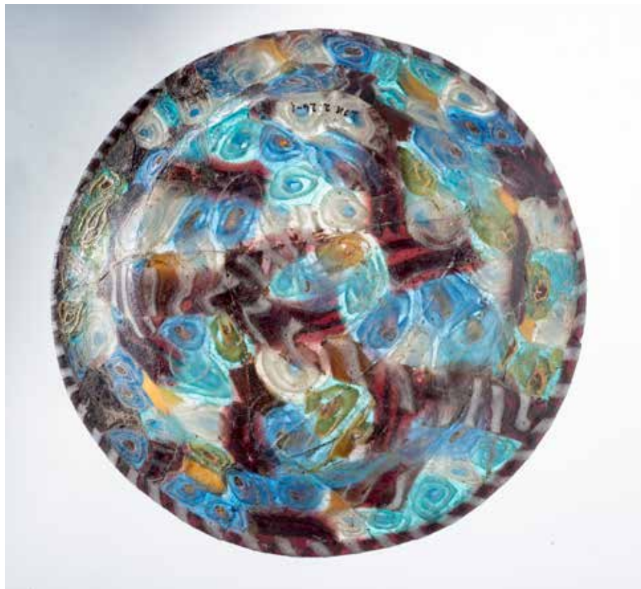
Coupelle mosaïquée en verre, technique du millefiori, 1 er siècle av. J.-C. / 1 er siècle ap. J.-C., aire funéraire d'I Ponti, Mariana.